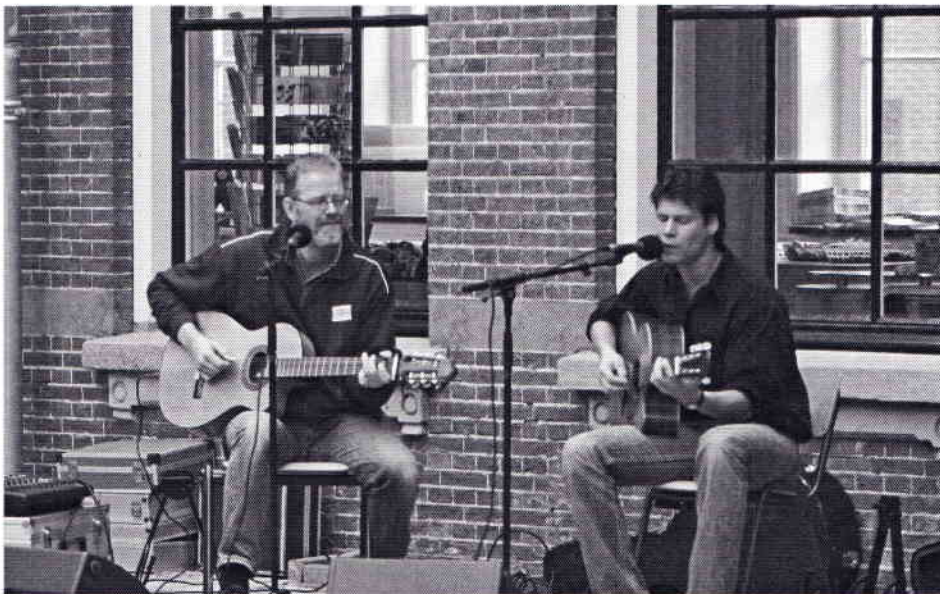
Dat onze voorzitter meer kan dan prepareren laat hij hier zien. Bij een jubileum hoort natuurlijk muziek.