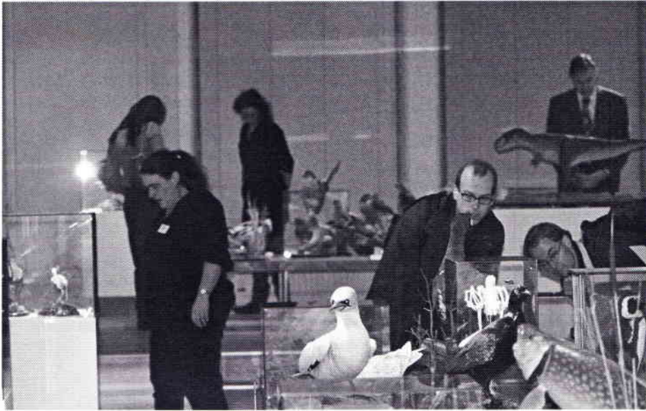
Niet alleen de jury had een kritisch oog voor detail.