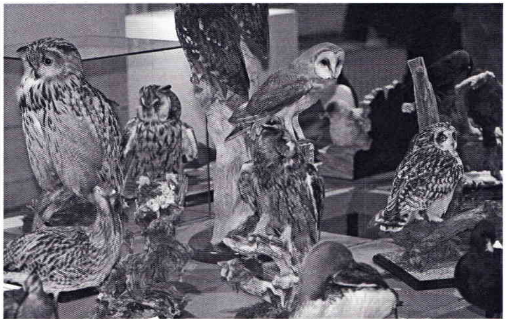
Uilen blijven geliefde vogels om te prepareren. Hier een groepje dat je niet snel samen in het wild zal aantreffen.