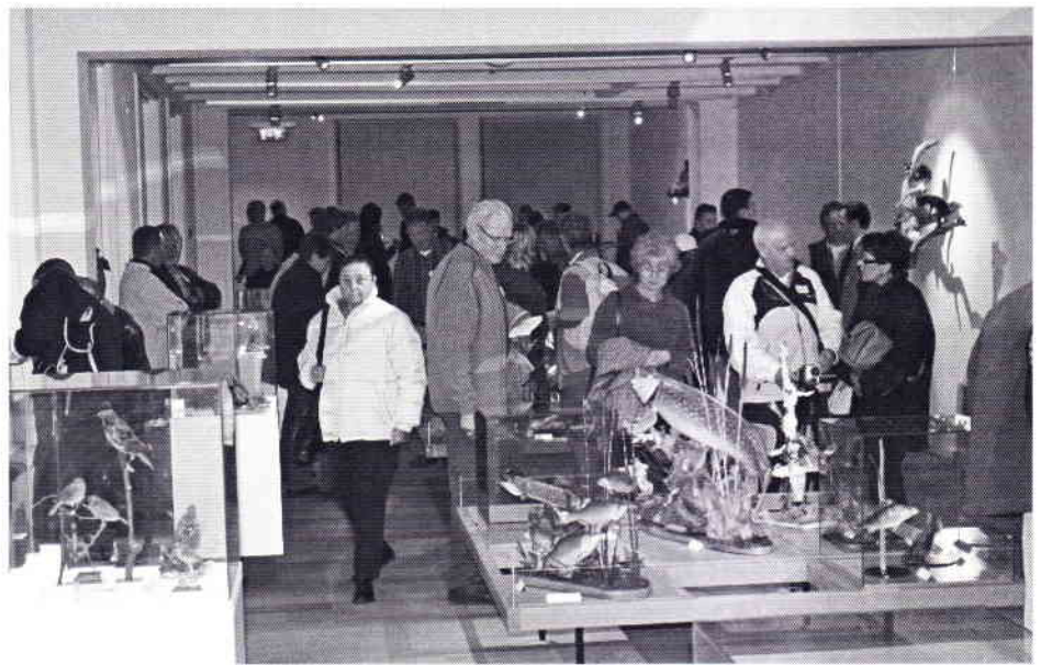
De ruimte was bijna te klein voor alle be- zoekers