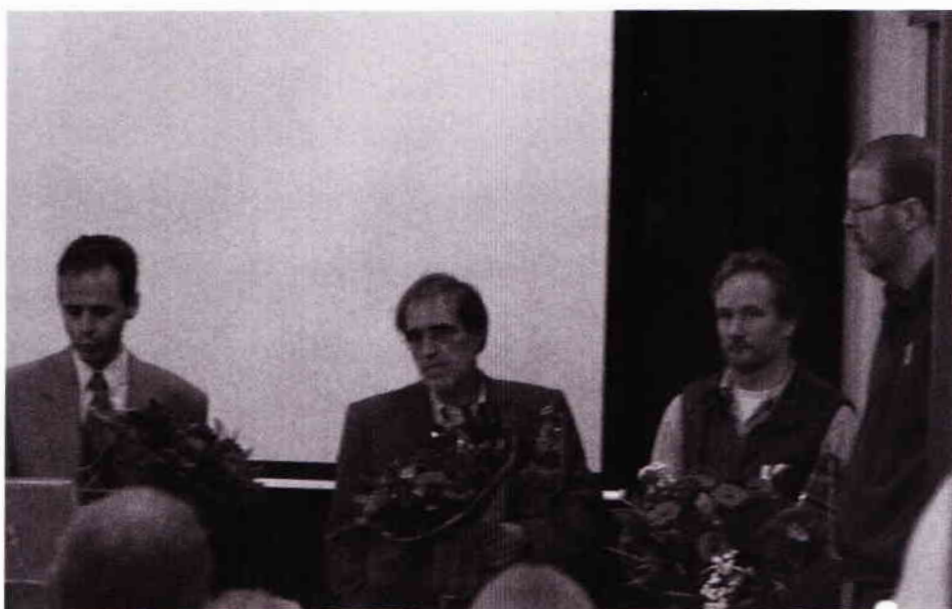
De jury wordt be- dankt voor de vele uren werk.