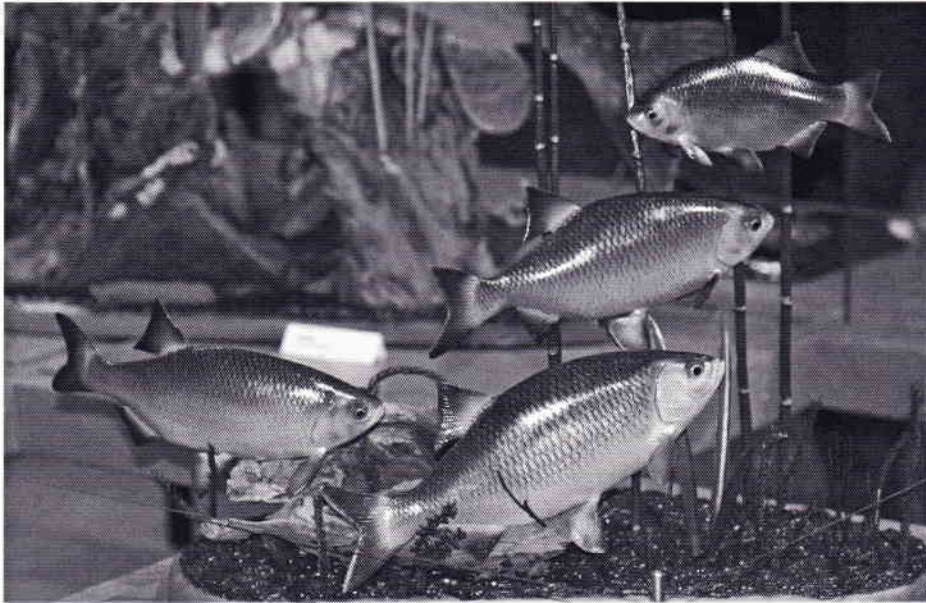
Een fraai schooltje ruisvoorns gemaakt door B. van Lohuizen